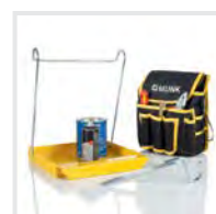
Praktische Helfer 1 Bestell-Nr. 19327