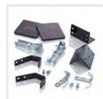
Leiterkopfsicherungen Komplett-Set Bestell-Nr. 19309