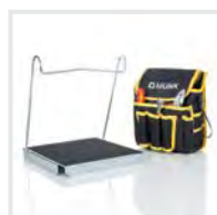
Sicherer Stand Bestell-Nr. 19324